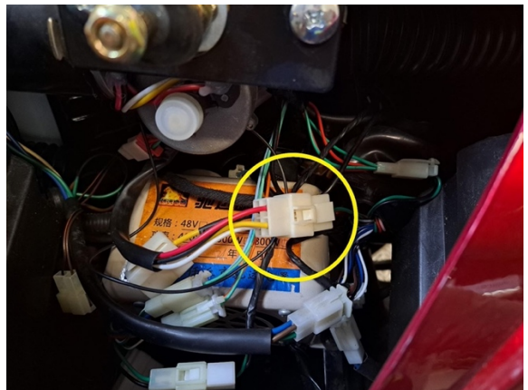
Avaa tuulilasipyyhkijän moottorin liitin.