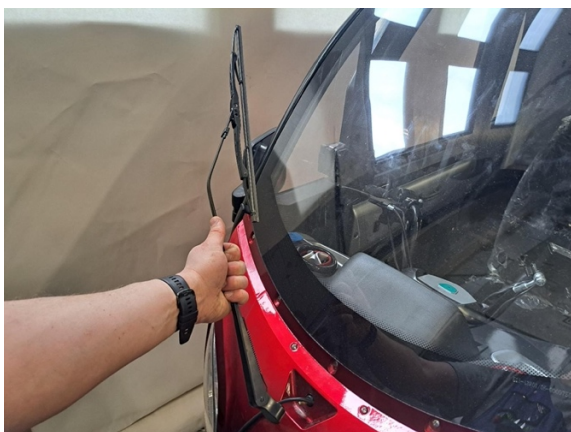
Ota tuulilasinpyyhkijä pois.