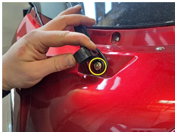
Irrota tuulilasinpyyhkijän kiinnitysmutteri. (kiintoavain 10 mm).