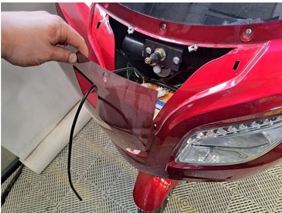
Ota keulamaskin yläpaneeli pois.