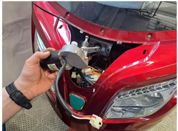
Ota tuulilasipyyhkijän moottori pois.

Uuden osan asennus käänteisessä järjestyksessä.