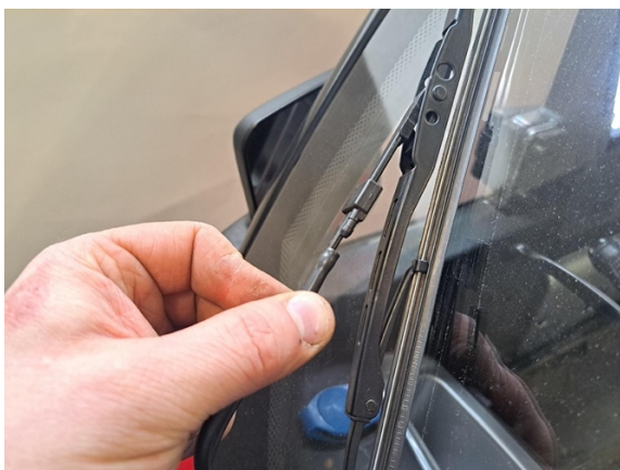
Ota tuulilasin pesurin letku irti.